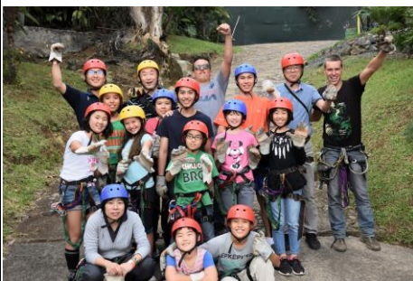
高学年 キャノピー

歴史博物館では薬草についても学ぶことができました。どの草が何のために使われるか分かりました。ぜひ家にも植えることができたらいいです。来年の宿泊学習も楽しみにしています。