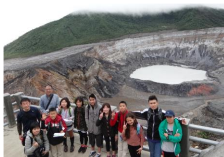
高学年 ポアス火山見学