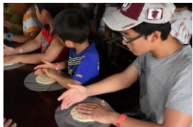
トルテージャ作り